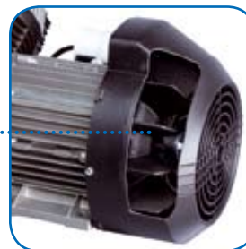
Ventola di raffreddamento Cooling fan

Base di supporto con 4 piedi antivibranti Base plate with 4 vibration/damper feet